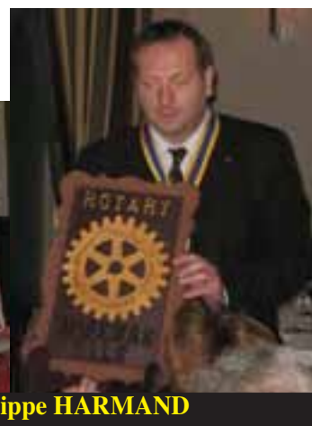
Aubenas