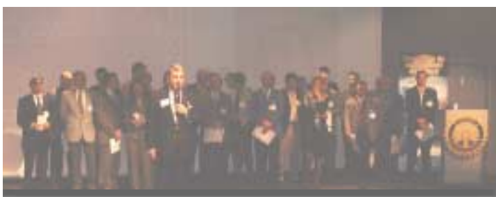
La Conférence du District du 17 novembre 2001 : les nouveaux rotariens.