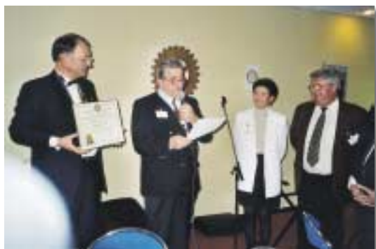
Remise de Charte au Club de Bourgoin-L'Isle d'Abeau le 14 décembre 2001