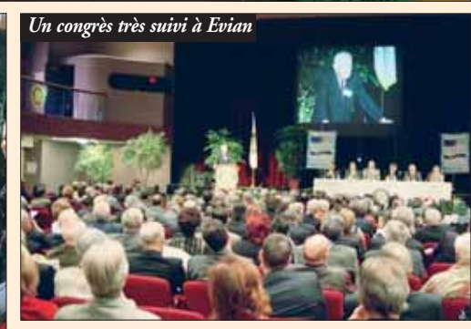
Un congrès très suivi à Evian