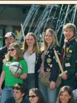
Une forte participation aux séminaires