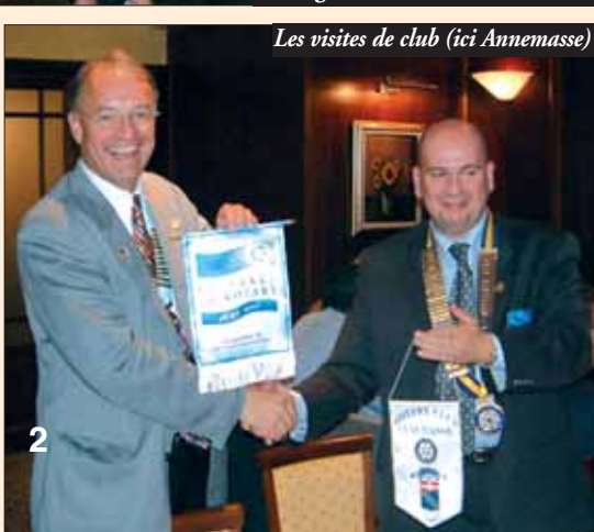
Les visites de club (ici Annemasse)