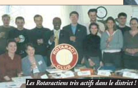
Les Rotaractiens très actifs dans le district !