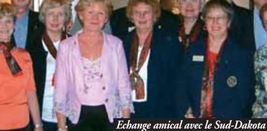
Echange amical avec le Sud-Dakota