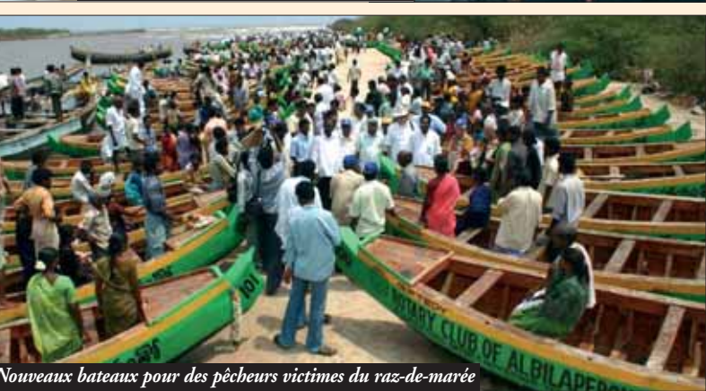
Nouveaux bateaux pour des pêcheurs victimes du raz-de-marée