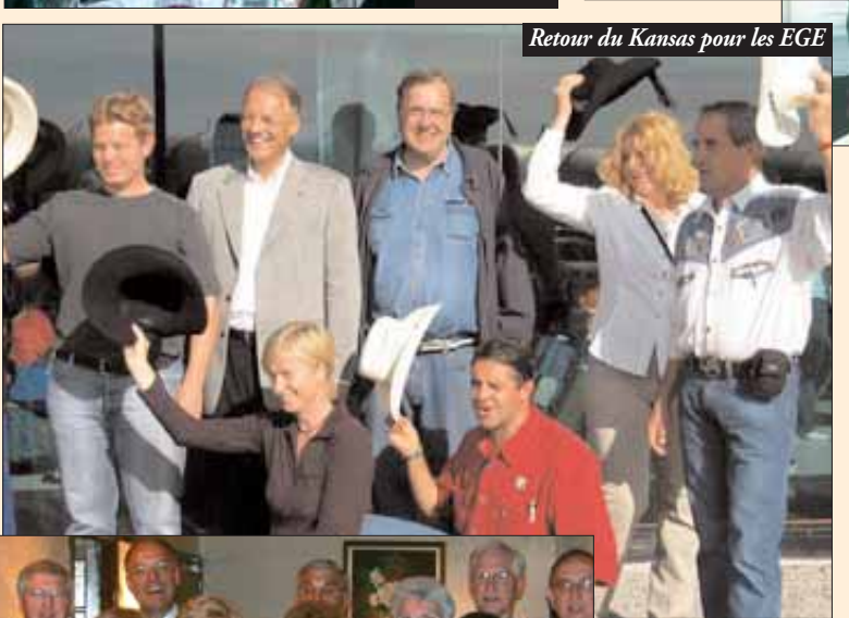
Retour du Kansas pour les EGE