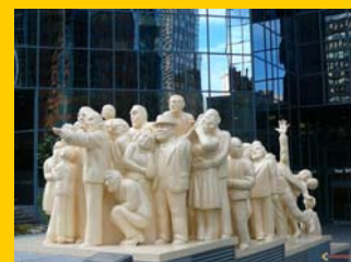
La Foule illuminée (Montréal)